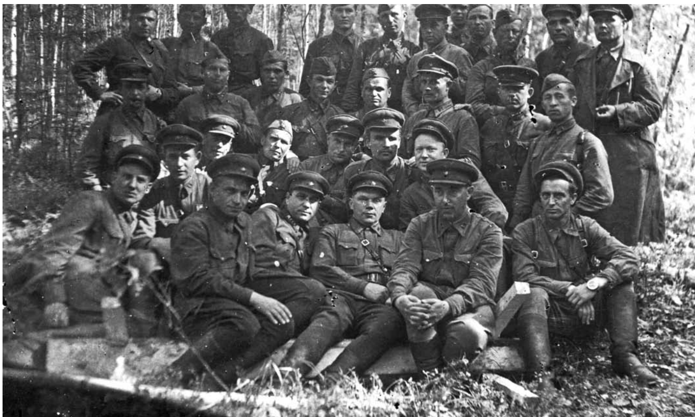
Бойцы 376-й стрелковой дивизии в период обороны у д. Спасская Полисть Новгородской области. Лето 1942 г.

перерезал существующий коридор, который был быстро восстановлен. Дивизия продолжала бои. 10 мая 1942 года до соединения с войсками 2-й Ударной армии в районе Мостков оставалось около километра, но противник нанес удар и окружил передовой 1248-й стрелковый полк. Ударом сводного отряда кольцо окружения было прорвано, полк вышел к своим, и 14 мая 1942 года дивизия вновь встала на прикрытие узкоколейки и Северной дороги. Затем дивизия возобновила наступление севернее Мостков и в течение двух недель вела тяжелые бои, ежедневно отвоевывая по 200–250 метров болот, и, в конце концов, вышла на рубеж ручья Горевой, впадающего в Полисть. На 1 июня 1942 года в дивизии было 4 580 человек. К концу июня 1942 года в ней оставалось только 1 256 человек личного состава.