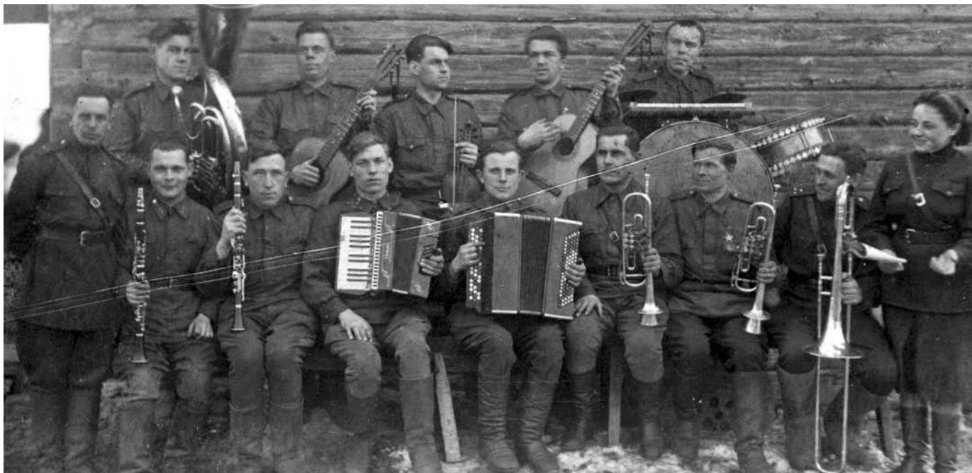
Волховский фронт. Музыкальный ансамбль 376-й стрелковой дивизии. 1943 г.