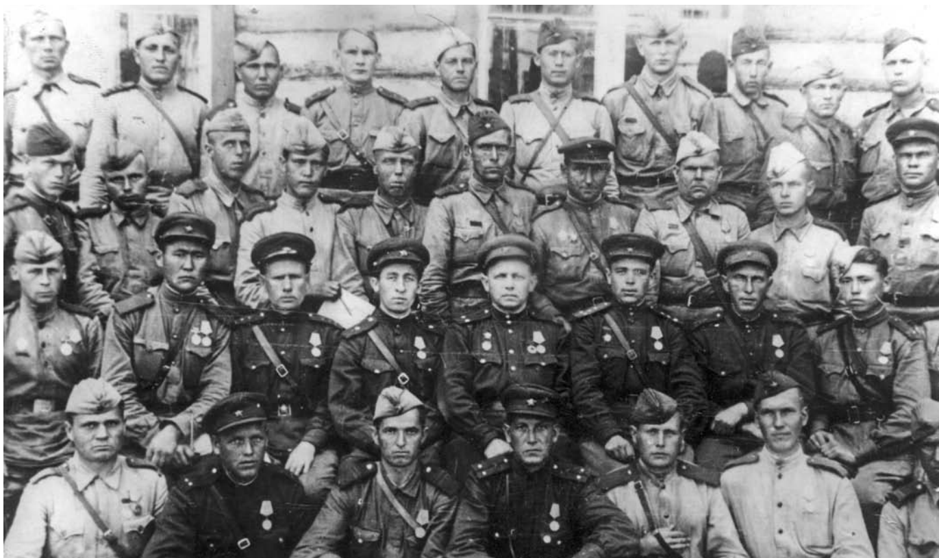
Слет редакторов боевых листовок 376-й стрелковой дивизии.