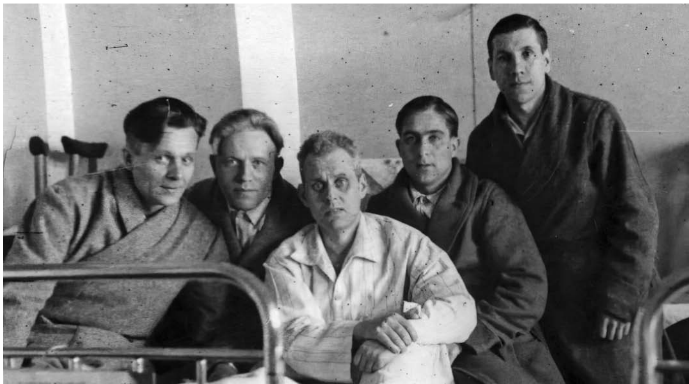
Бойцы в госпитале. 1943 г.