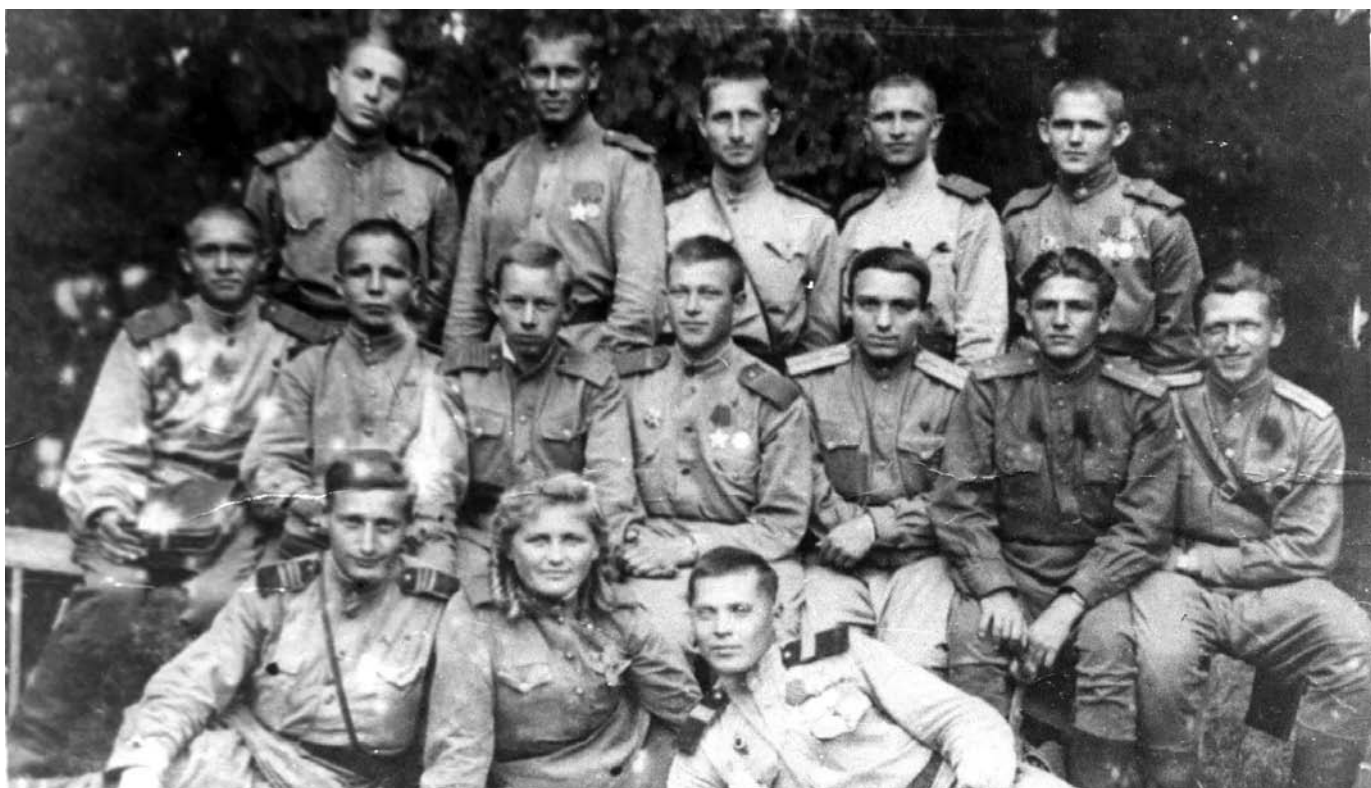
Комсорги 844-го артиллерийского полка 303-й стрелковой дивизии. Октябрь 1944 г.