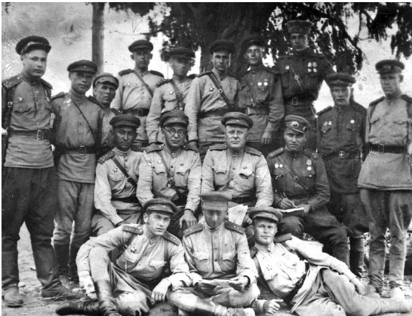
Командный состав 845-го полка 303-й стрелковой дивизии. В окрестностях г. Будапешта. 1 января 1945 г.