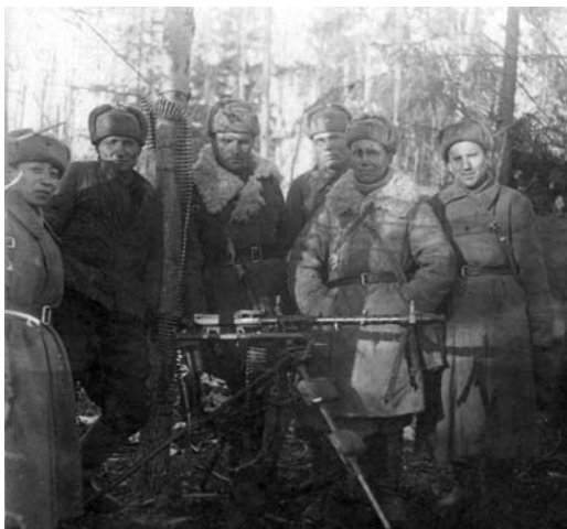
Бойцы 376-й стрелковой дивизии.