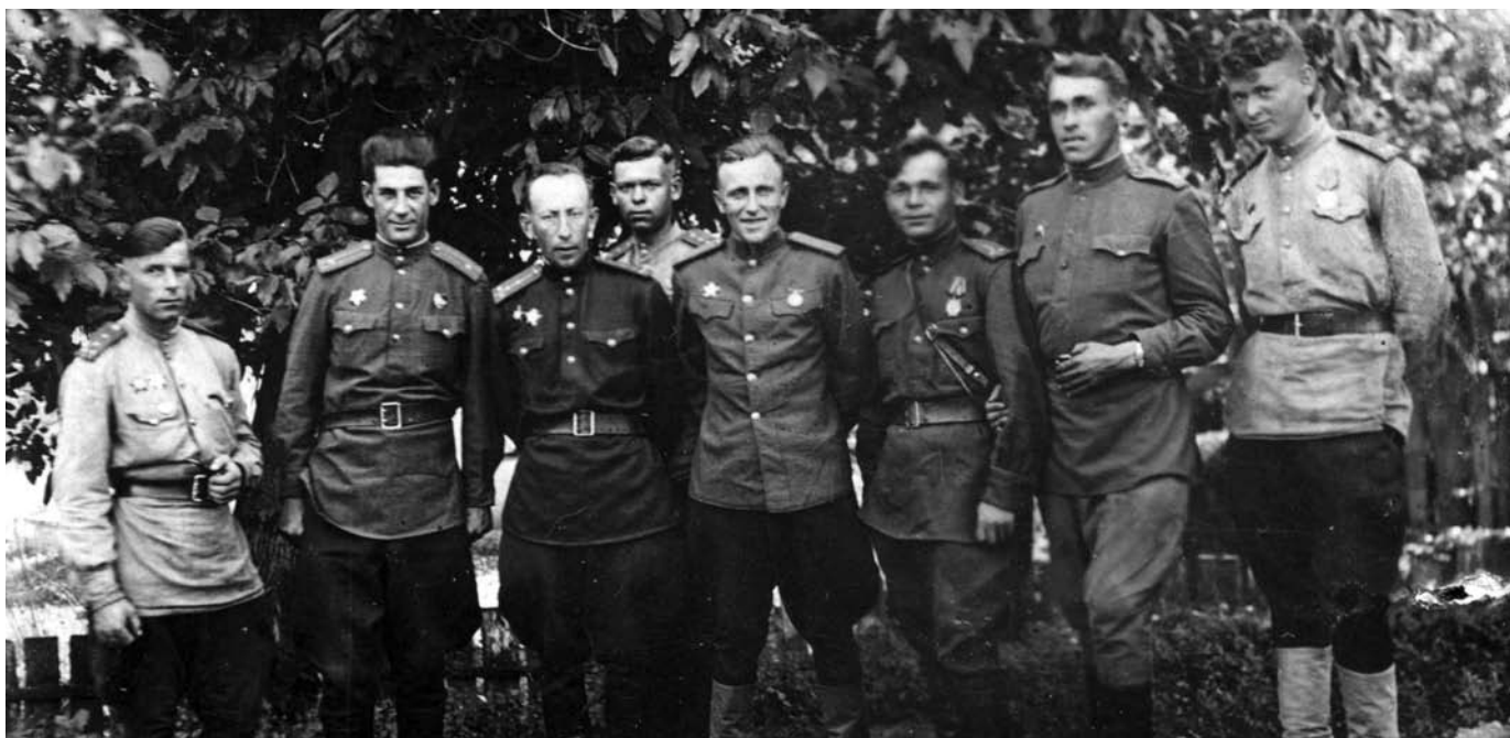
Штаб 847-го стрелкового полка 303-й стрелковой дивизии. 1944 г.