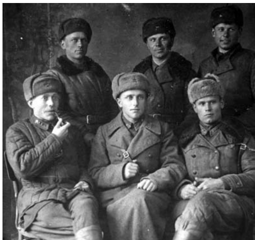
Разведчики 303-й стрелковой дивизии.