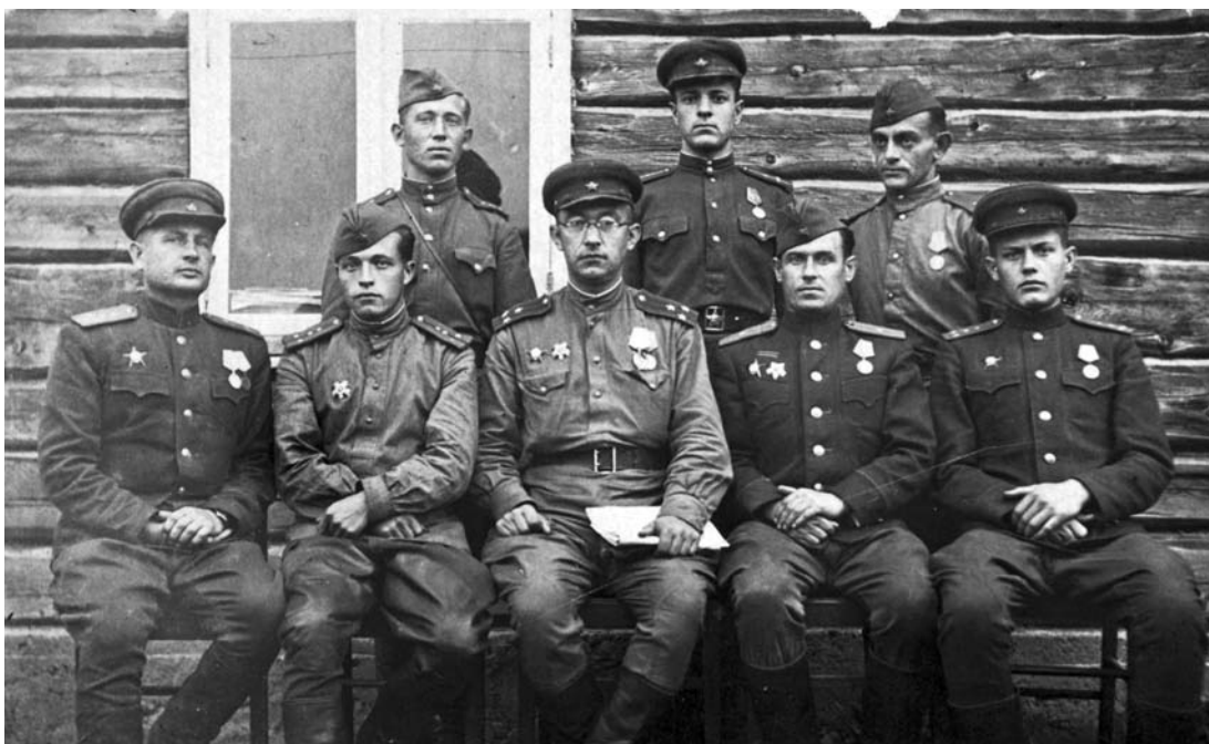
Офицеры штаба 376-й стрелковой дивизии. 4 сентября 1944 г.