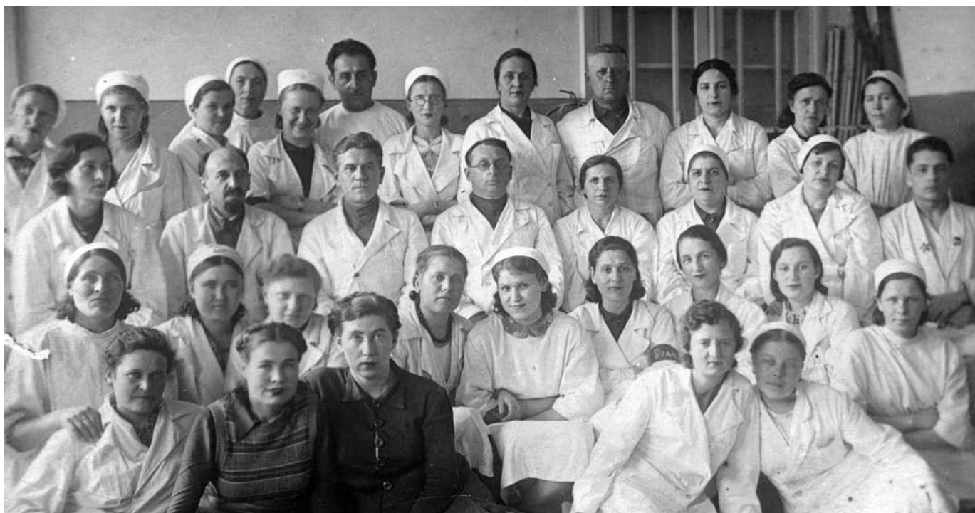
Медицинский персонал эвакогоспиталя № 3629 г. Кемерово. Март 1944 г.